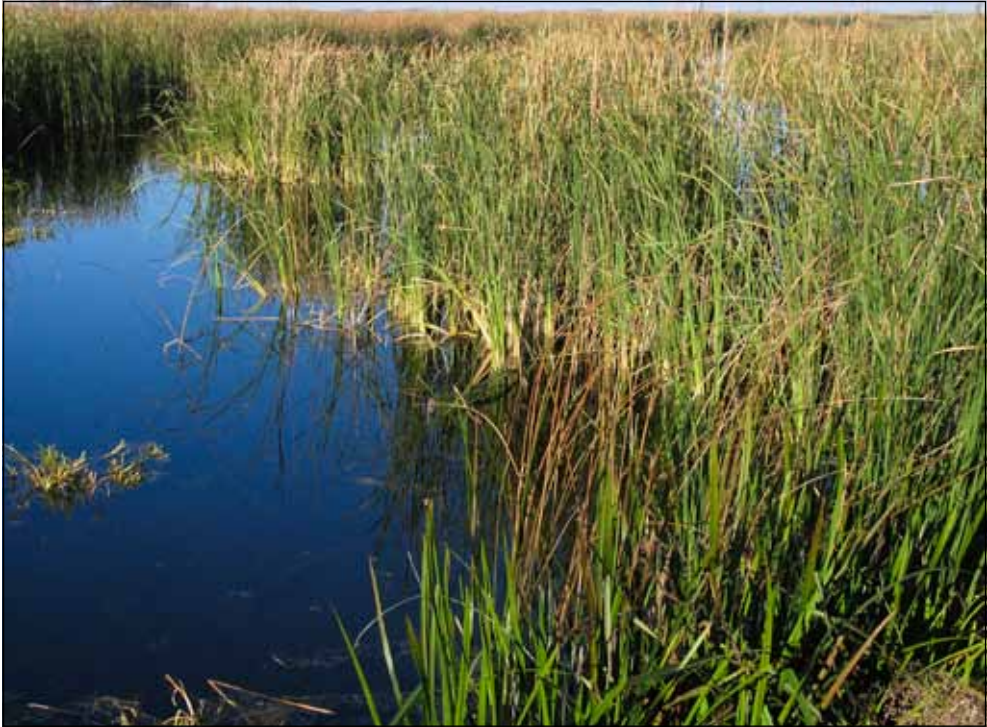
Sekély vízben álló gyékényes

13. A száraz vagy kiszáradt termőhelyek (pl. kunhal- mok, sztyeplejtők, domboldalak, egykori patakmer- der) nádas foltjai (megfelelő gyepek kategóriába vagy OC-be sorolandók).